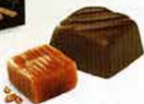
Praliné et Caramel au beurre salé de Guérande Chocolat au lait