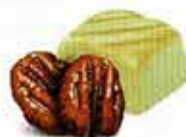
Praliné et Éclats de noix de pécan caramélisées Chocolat blanc