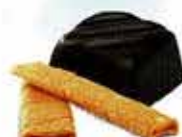
Praliné et Brisures de crêpe dentelle Chocolat noir